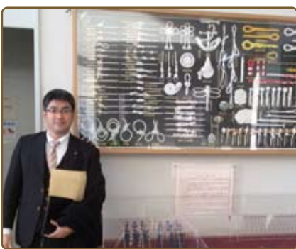
▲2016 年 11 月 12 日北海道立漁業研究所視察