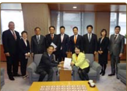
▲ 2016 年 12 月 1 日京都府へ予算要望提出