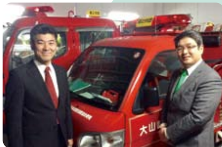
▲12月25日 年末警戒の消防団を激励