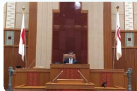
▲11月19日～20日 視察で沖縄県議会へ