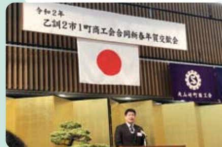
▲1月7日 商工会の年賀交歓会にて挨拶