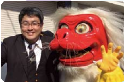
▲11月10日 ガラシャ祭りにて