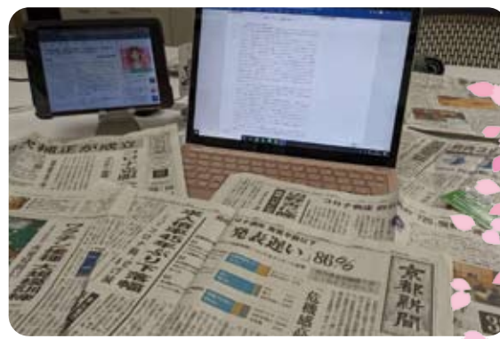
▶2月5日 代表質問の原稿執筆中