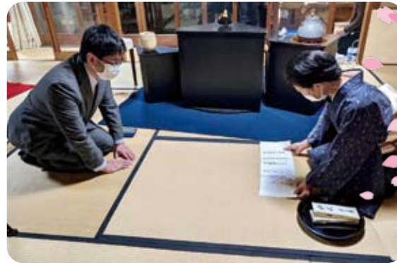
▶2月16日 お茶の許状を頂く