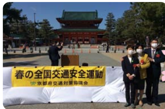
▶4月5日 春の交通安全運動スタート式