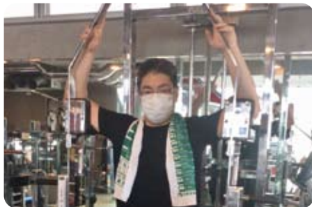
▲ 6月26日 年末から10kg減量