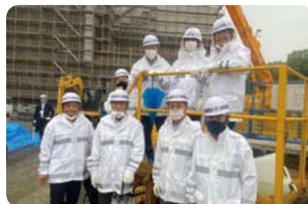
▲ 7月7日 乙訓議員団でいろは呑龍トンネル視察