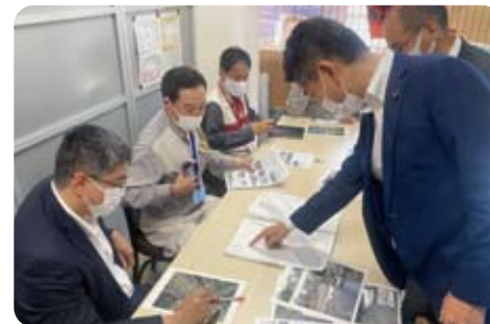
▲ 6月14日 泉ケンタ衆議院議員と地元要望対応