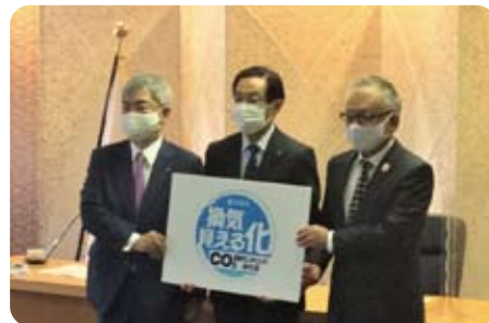
▲ 5月25日 セブン商店会と村田製作所の新型コロナ対策実証実験締結