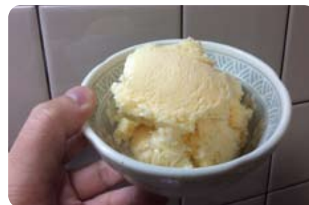
▲ 7月14日 手作りアイスクリームを自作

皆様、日頃のご指導に心から感謝申し上げます。今回は災害対策についてお伝えします。静岡県熱海市で大きな土砂災害が発生しました。被害に遭われた皆様に心よりお見舞い申し上げます。改めて乙訓でも自然災害に注意を払わねばなりません。 災害対策の指針では「土砂災害警戒情報」が出た時点で、ハザードマップの「土砂災害警戒区域」にお住いの方に「全員避難」が発令されるはずでした。しかし今回の事案では、前日に氣象台と静岡県から「土砂災害警戒情報」が出されていたにも関わらず、警戒区域の住民には「全員避難」の指示が出されていなかったのです。