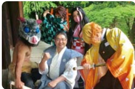
▲ 4月17日 宝積寺 大厄除追儺式（鬼くすべ）