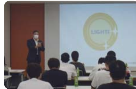
▲9月5日 ダイハツ労働組合の新人研修で講演