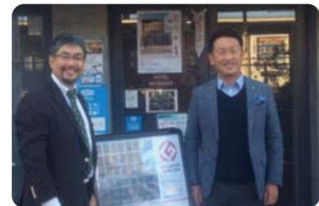
▲10月30日 ホテルディスカバー長岡京 グッドデザイン賞受賞記念式