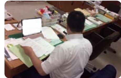
▲9月11日 議会にて事務作業