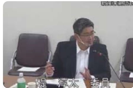
▲10月1日 新産業創造特別委員会