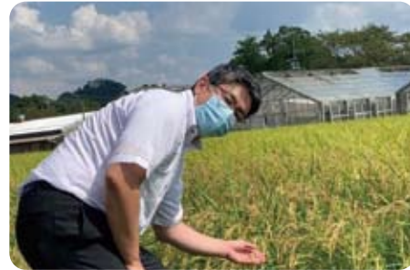
▲8月27日 府民クラブでの管内視察