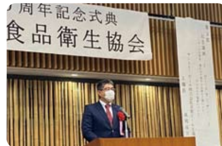
▲10月13日 乙訓食品衛生協会 40周年記念式典