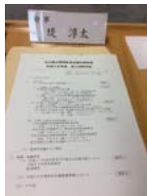
6月6日北方領土返還要求