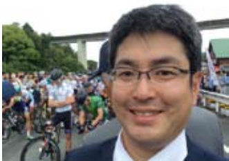
5月30日ツアーオブジャパン開会式