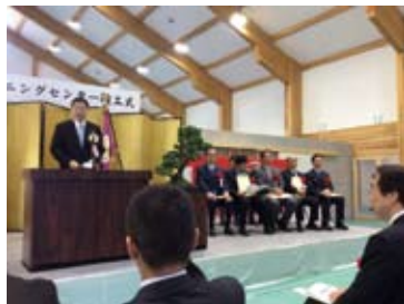
6月18日トレーニングセンター竣工式