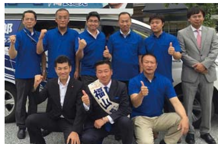
7月10日福山哲郎参議院議員選挙応援