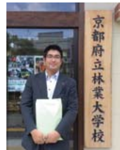
7月21日林業大学校視察