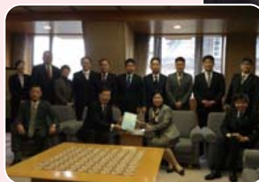
京都府への予算要望