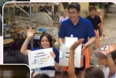
選挙権の啓発活動