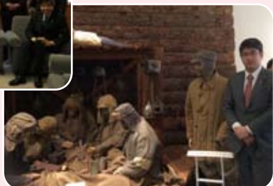
世界記憶遺産に認定された 舞鶴引き上げ記念館にて