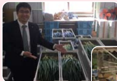
新設された 九条ネギ調整包装施設