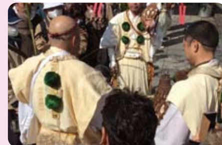
▲2月19日 楊谷寺で開眼大護摩供