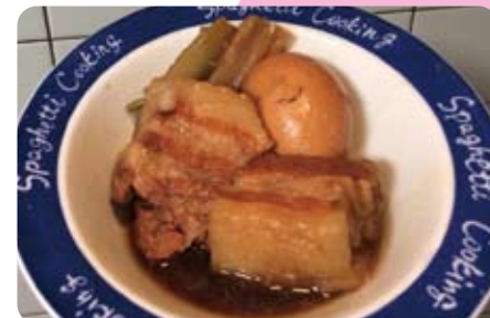
▲1月30日 自炊で豚の角煮を作る