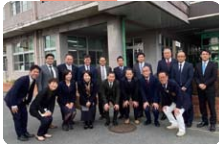
▲1月14日 向日が丘支援学校の視察