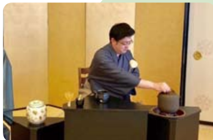
▲2月9日 光明寺の月釜茶会でお点前