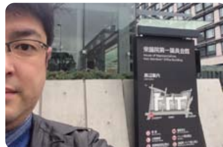
▲1月22日 勉強会で衆議院会館へ