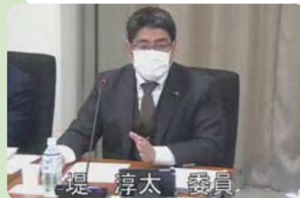
▲2月13日～3月19日 京都府議会2月定例会