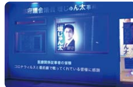
▲5月11日 医療関係者を応援しブルーライトアップ