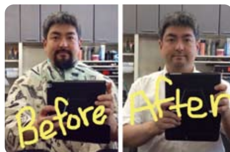
▲6月26日 劇的なビフォー・アフター