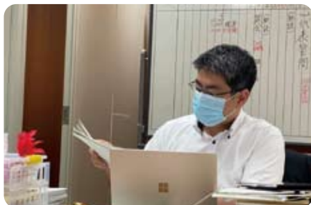
▲6月11日～30日 京都府議会6月定例会