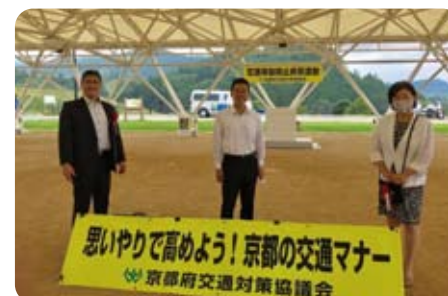
▲7月20日 夏の交通事故防止府民運動スタート式