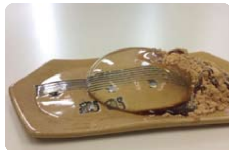
▲4月24日 水信玄餅を試作