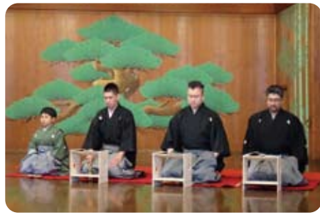
▲ 11月2日 嘉祥閣にて謡の発表会