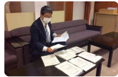
▲ 11月30日～12月21日 京都府議会定例会