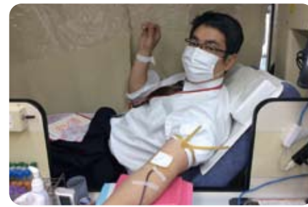
▲ 11月25日 400ml 献血