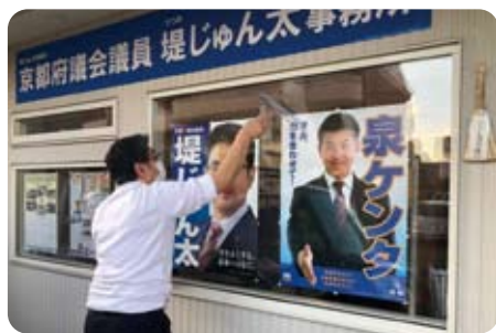
▲ 12月28日 事務所大掃除