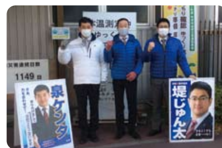
▲ 1月6日 ダイハツ京都工場で挨拶活動