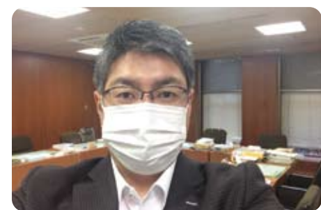
▲ 1月18日 緊急事態宣言を受けての政策調査